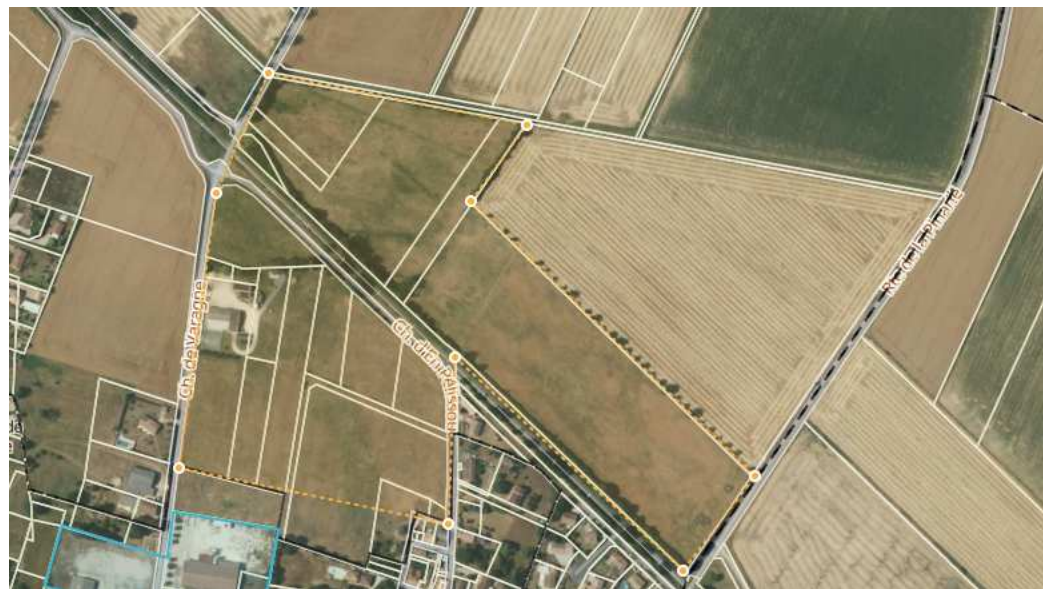
5/ Syndicat de l'eau - solaire photovoltaïque au sol