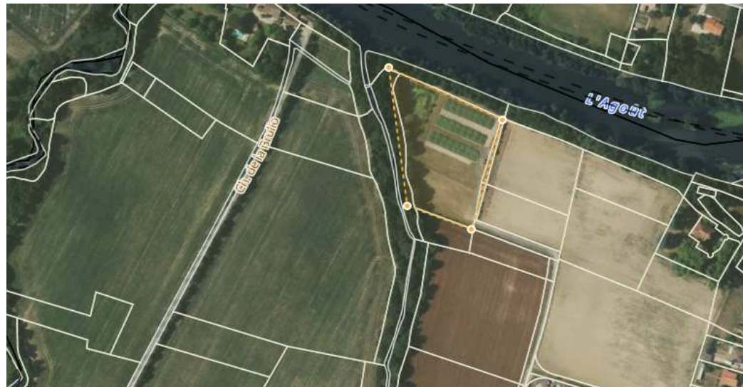
3/STEP - solaire photovoltaïque au sol