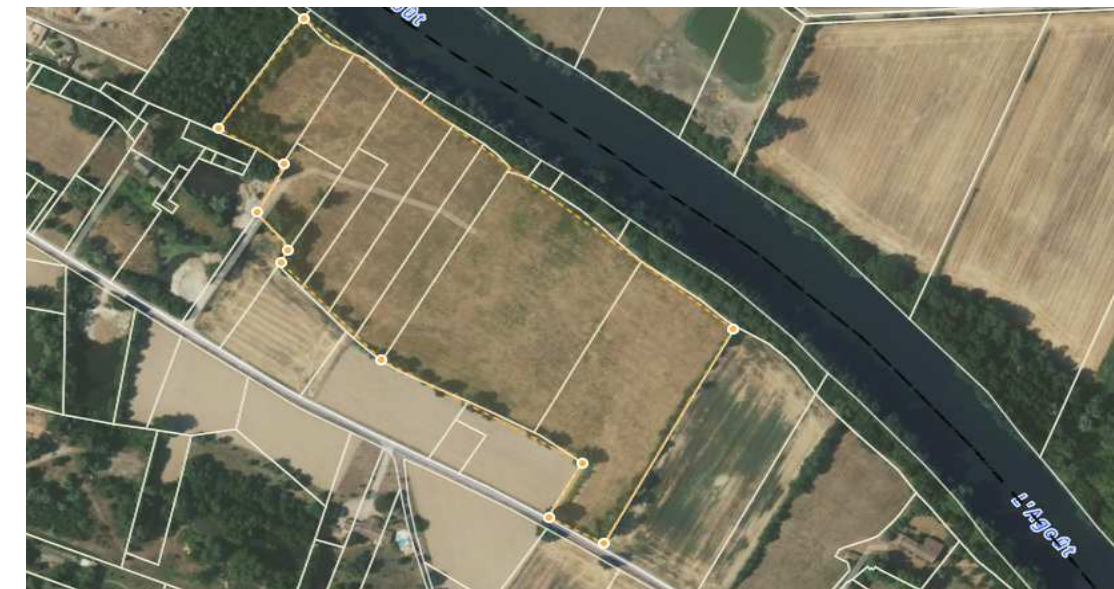
6/ Chemin des Graviers - solaire photovoltaïque au sol